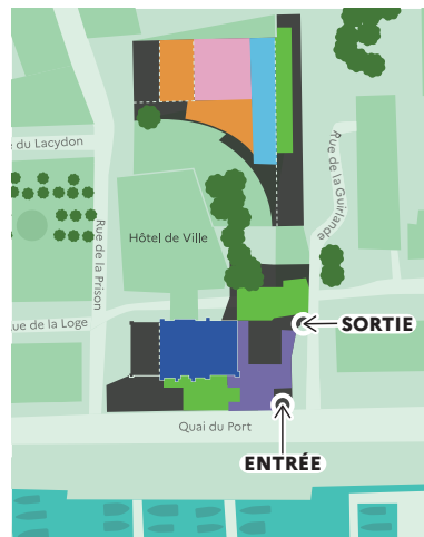
Hôtel de ville, Place Villeneuve-Bargemon 13002 Marseille