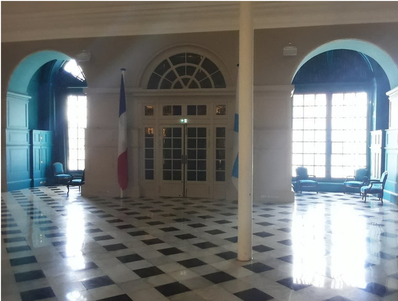
L'intérieur du Pavillon Puget