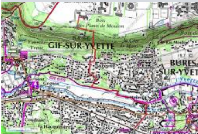
Accès à l'IPhT à pied à partir du RER

A l'entrée du CEA Orme des Merisiers, roulez tout droit sur environ 600 m, puis tournez à droite et gardez-vous sur le parking, vous êtes devant l'entrée de l'IPhT.