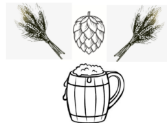
LPNHE Beer Brewing Contest