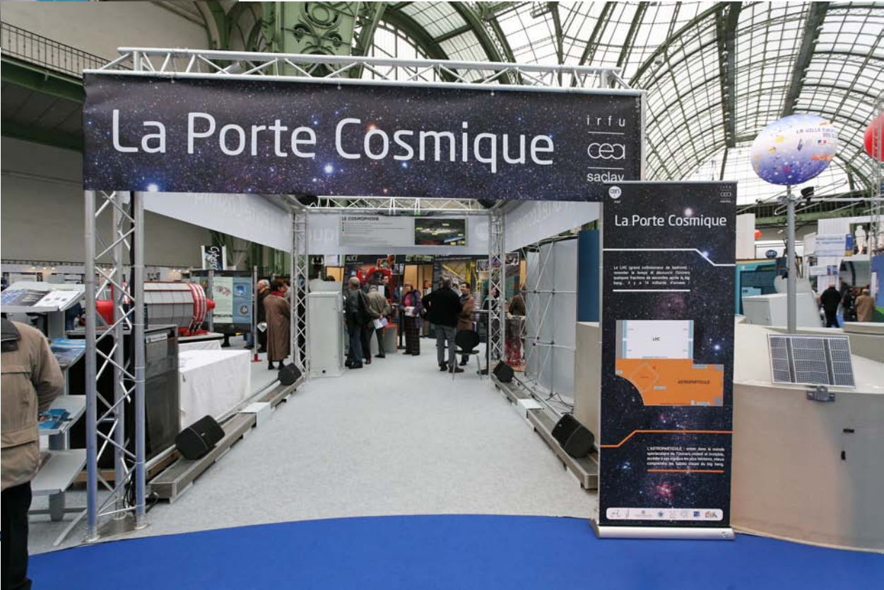
Perrine Royole-Degieux | VES – réunion des